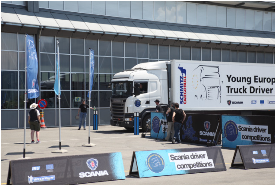
Der Wettkampf konnte beginnen.