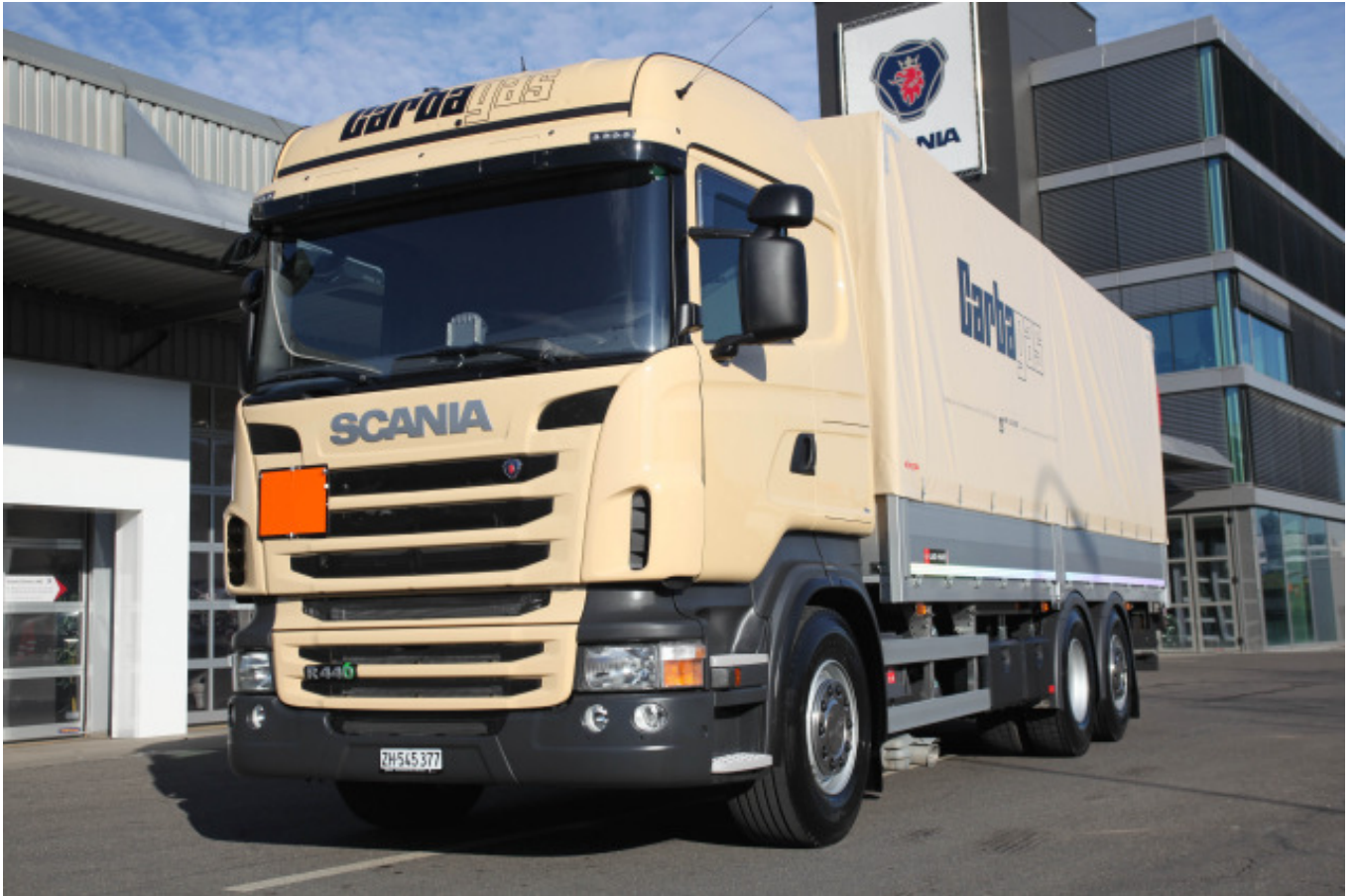
Das neue Fahrzeug im Fuhrpark von Werner Ryser ist ein Scania R440 LB 6x2*4.