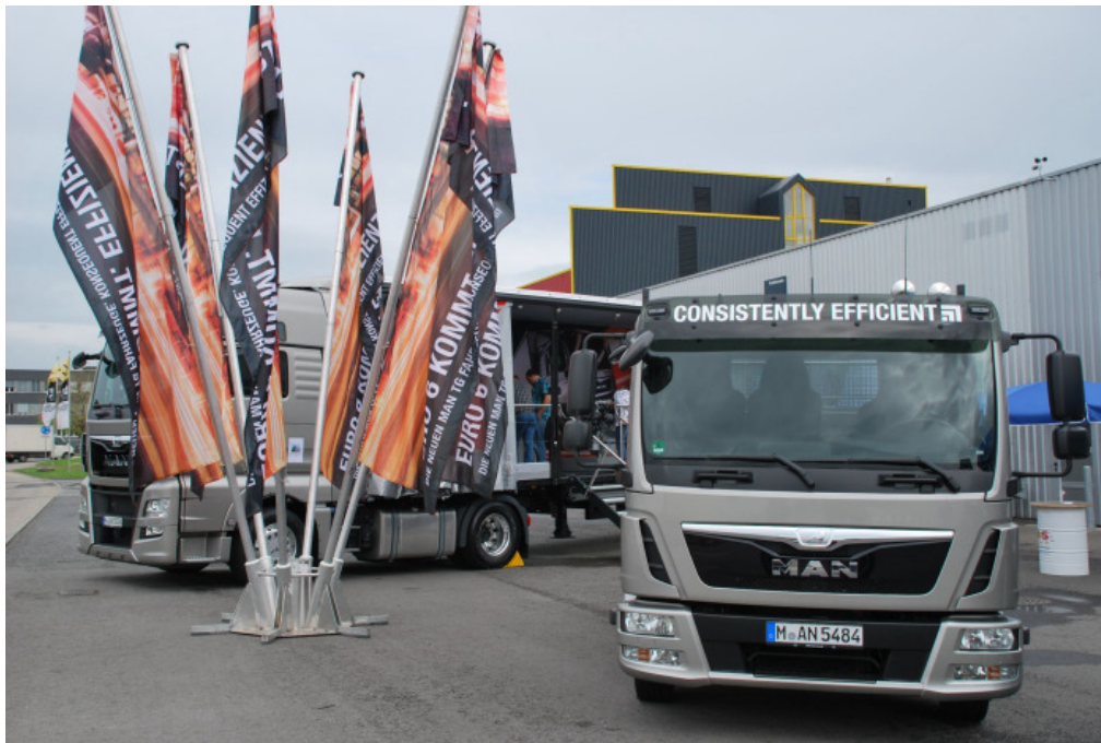
Start TG RoadShow in Emmen