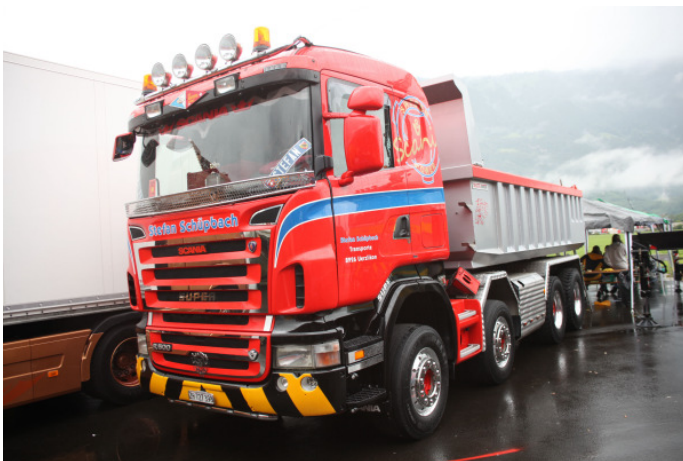
Photo 3 : pour le plus joli Scania avec fanion de « Les Routiers Suisses », Stefan Schüpbach pouvait obtenir le plus de points avec son Scania R500 CB 8x4.

Photo 2 : le truck vainqueur dans la catégorie « plus jolis Scania » était le Scania R500 LB 6x2*4 (milieu) de Remo Gerber.