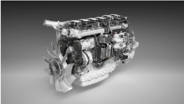
DC13 147 450 Euro 6