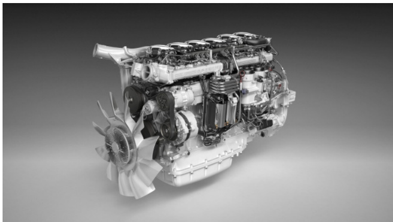
DC13 147 450 Euro 6