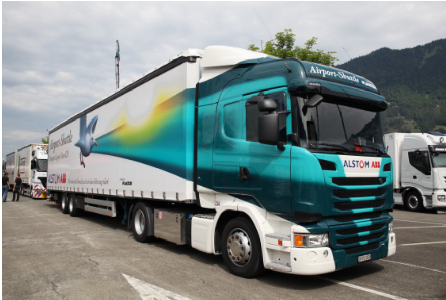
Le Scania G450 LA 4x2 de Markus Rüegg.