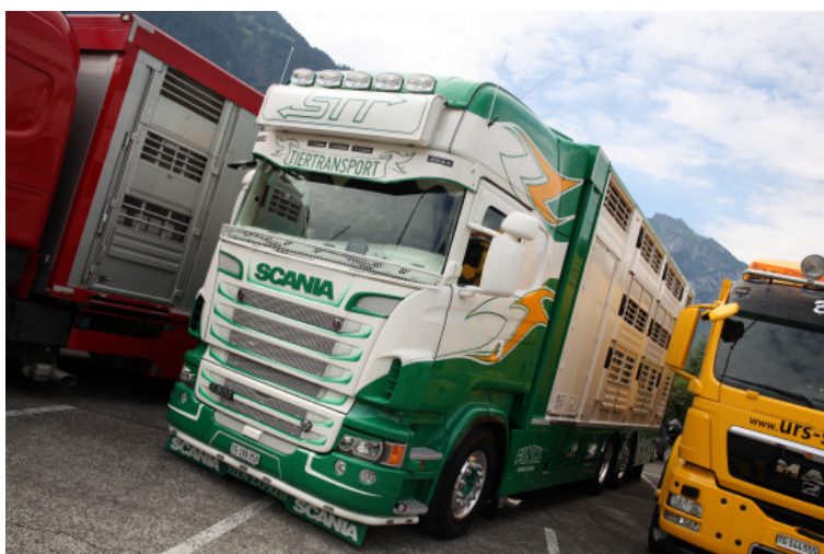
Point de mire: le Scania R500 LB 6x2*4 de Florian Stutz.